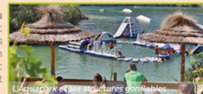
L'Aquapark et ses structures gonflables

Profitez d'un espace dédié au fun pour toute la famille avec un ventriglisse, un parcours d'obstacles, une pyramide, un mur d'escalade avec toboggan, 2 trampolines et une catapulte.